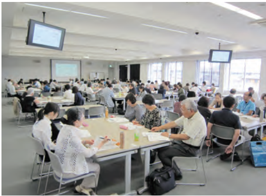
参加者の熱気に包まれる会場

アンケートでは「記録に対する悩みや不安が解消された」や「明日からまた頑張れる気がする」など嬉しいお言葉をいただきました。今後も生活支援員の資質向上やモチベーションの維持・向上につながるよう取り組んでいきます。