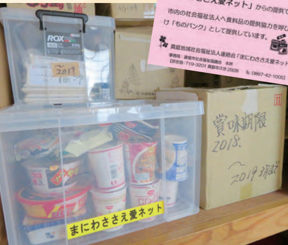
◀今回集まった食料品

この品物は、 「まにわささえ愛ネット」からの提供です。 市内の社会福祉法人へ食料品の提供協力を呼びかけ「ものバンク」として提供しています。 真庭地域社会福祉法人連絡会「まにわささえ愛ネット」 事務局：真庭市社会福祉協議会 本部 【TEL】719-32017 電話番号 2928 【FAX】719-32017