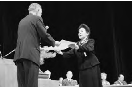
県社協会長より濟世賞を授与

ない音を大事にすることなどについて、お話しいただきました。 なお、岡山県社協会長表彰並びに感謝の受賞者は、次のとおりです。 受賞者の皆様、おめでとうございます。