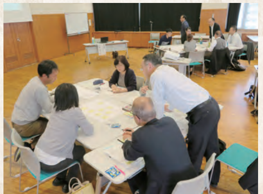
セミナーグループワークの様子

法人間や地域との連携・協働による課題解決に向けて必要となる社会福祉法人の役割や地域公益活動の基本的な理解を目的にセミナー