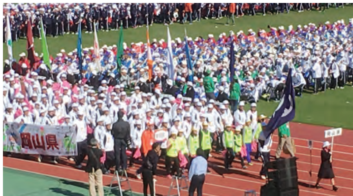
総合開会式時の入場行進の様子

ペタンクでは「岡山県瀬戸内クラブ」が73チームの中で準優勝に輝き、ソフトバレーボールでは「桃太郎」チームが予選リーグを1位で突破し、1位グループの第