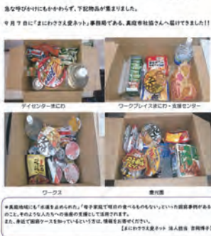
吉岡副会長作成 「慶光会法人本部ニュース」

会議の中で、家庭の事情でご飯をきちんと食べられていない子どものために「ものバンク」の繋がりを活かしたいという意見が出ていました。これから先のある子どもだからこそ、少しでも救えるなら救いたいという思いを皆さん持たれています。市役所の子育て支援課や民生委員・児童委員の協力